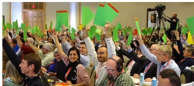
Гласуване на общото събрание на FSC, 2017

Ние работим с публични и частни собственици на гори или с клиенти, стопанисващи гори. Нашите клиенти варират от дребни стопанства с площ под един хектар до ключови доставчици на водещи световни компании с милиони хектари сертифицирана площ. Сертифицираме обща горска територия от над 67 милиона хектара, разположени на шест континента по целия свят, което представлява една трета от всички FSC сертифицирани гори.